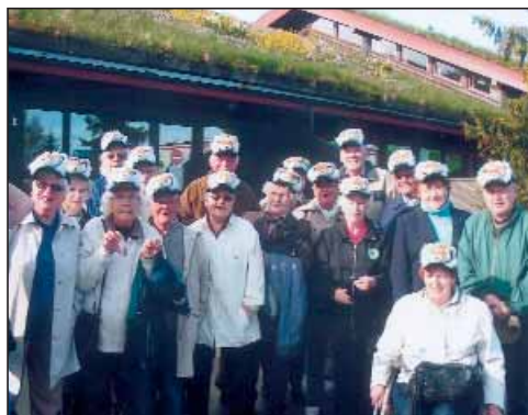
Denne flokken skremmer nok ingen!

Før avreise tredje dag var vi samlet til evalueringsmøte, og flere av deltakerne kom fram med sine tanker om aktiviteter som kan legges inn i en slik tredagerstur, som for eksempel båttur i skjærgården når været innbyr til det. Foreningene ble bedt om å komme med sine ønsker, og disse vil bli fulgt opp så langt det lar seg gjøre. På den måten er det mulig å sy