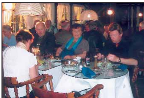
God atmosfære. Sjøføren i forgrunnen.

Om kvelden var det deilig treretters middag. Cees Verkerk underholdt med