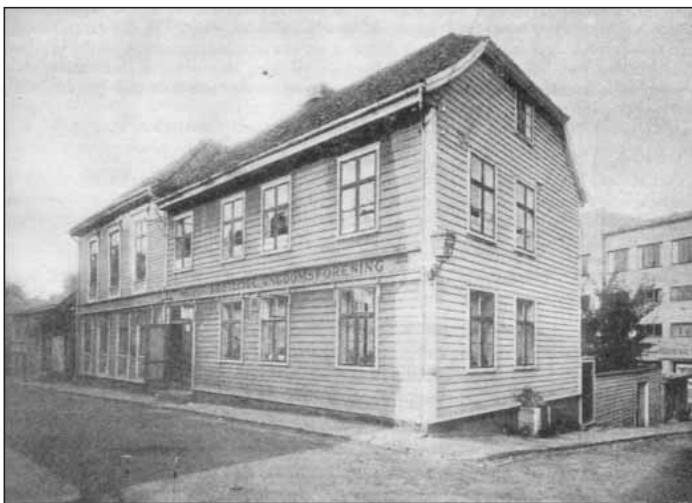
Ynglingens første lokaler fra 1868 var i Asylgaten 6. Senere ble det Madlaveien 24 og deretter Lassa hvor virksomheten i dag drives fra.

Ved de fleste skoler i dag får barn og unge tilbud om opphold på leirskoler. I den daglige undervisningen er lærerne opptatt av å ta elevene med ut av klasserommene og bruke naturen som kunnskapskilde, såkalt uteskole. Allerede så tidlig som i 1913 arrangert Ynglingen leir for sine medlemmer i Høgsfjorden. Da for-