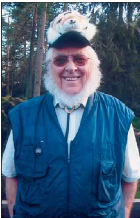
Tiger med løvemanke.

musikk, og de modigste våget seg ut på dansegolvet.