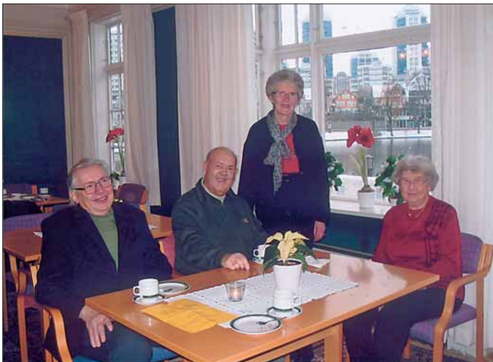
På eldrekafeen treffer hun gamle kjente.