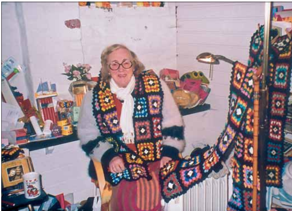
Hele byens tante har flyttet virksomheten til Øvre Strandgate og holder nå til like ved Lendeparken. Her lytter hun på radio mens hun selger lodd og hekler pledd og skjerf.