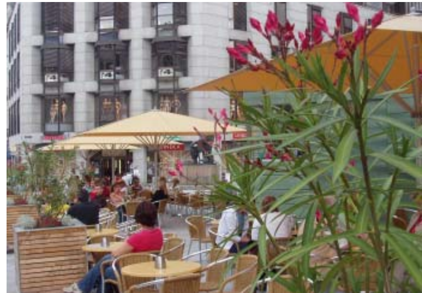
◀ Morgenstemning i Trastevere, Roma