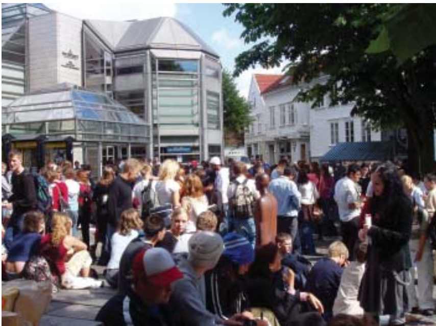
Noen steder bør det reserveres areal til andre aktiviteter, Arneageren.

Man vil kreve (og følge opp ved kontroller) at serveringene holder seg innenfor de avgrensede områdene som ligger til grunn for leieavtale med kommunen. Leietaker kan sies opp dersom noen av vilkårene i leiekontrakten, inklusive retningslinjer for plassering og utforming, brytes.