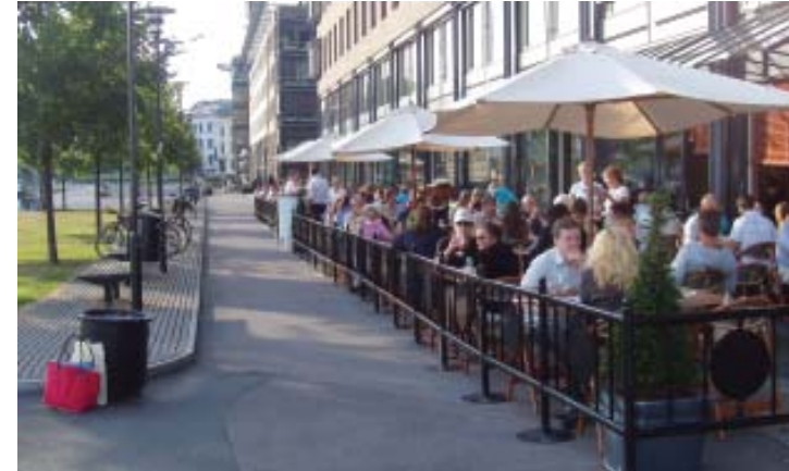
◆ Samme sted, med og uten inngjerding. Oslo.

Markisene bør ha rette kanter, være ensfargede og uten reklame, bortsett fra eventuelt firmalogo i små bokstaver på nedhengende kant foran.