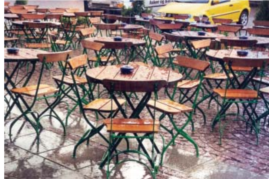
Små stoler og bord gir flere plasser og bedre tilpassing til underlaget, Oslo

Ved matservering ute er firkantede bord å foretrekke for bevegelseshemmede i rullestol.