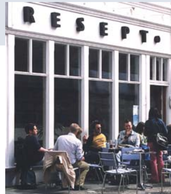
Bedre enn legemidler?

Uteserveringer skal kle byen og gjøre gater og plasser vakrere!