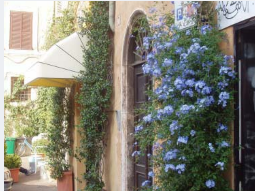
Overskudd kan være så mangt! Uteservering i Trastevere, Roma