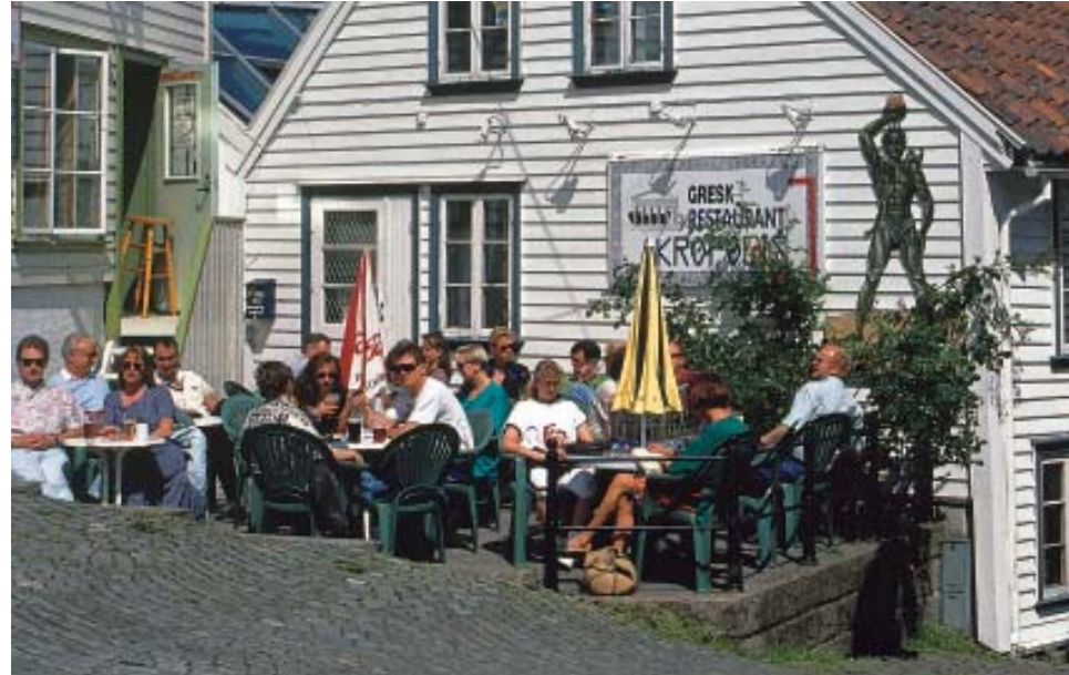
Gode sitteplasser i Sommer-Stavanger

Dette heftet handler om hvordan vi kan lage bykultur samtidig med serveringskultur.