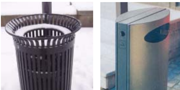
Gode og romslige boskasser

Se forslag til retningslinjer og "Vedtekt til plan og bygningsloven § 107, skilt og reklame, Stavanger kommune, gjeldende fra 01.04.1998".