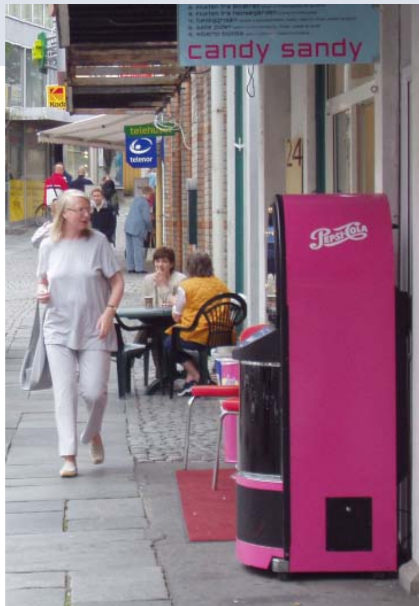
Er dette uteservering? Fra Nygata

"Vedtekt til plan- og bygningsloven § 107, Skilt og Reklame, Stavanger kommune", gjeldende fra 01.04.1998.