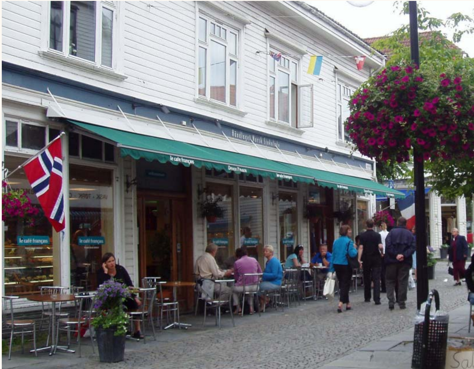
Godt plassert uteservering i Østervåg. Ingen reklame, kun navn på markisenedhenget. Blomsteroopheng på vegg som i gate, Østervåg.