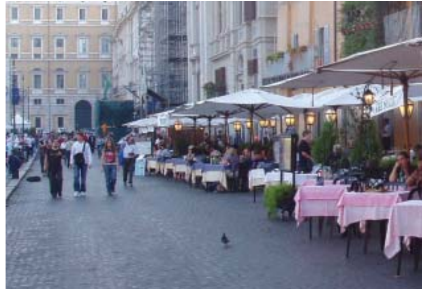
Sommeren er kommet til Karl Johan, Oslo ►