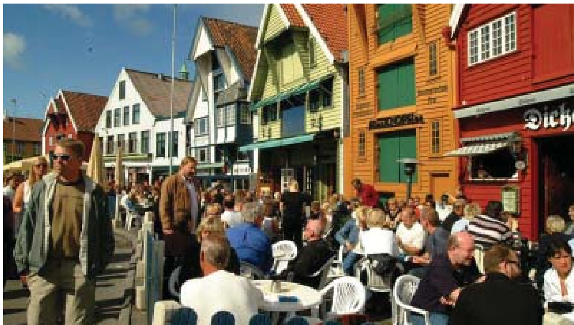
◀ Å se og bli sett ... Fullt på solsiden i Vågen