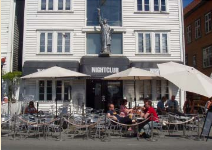
Sommeren 2005, Vågen i Stavanger