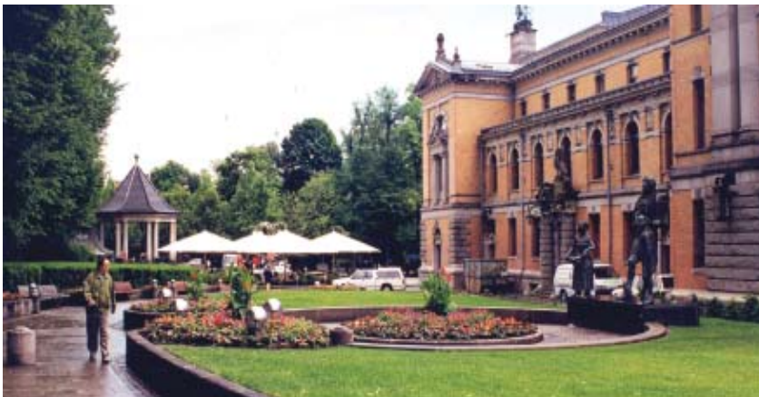
◀ Også i Norge er hvite parasoller det mest delikate, Oslo