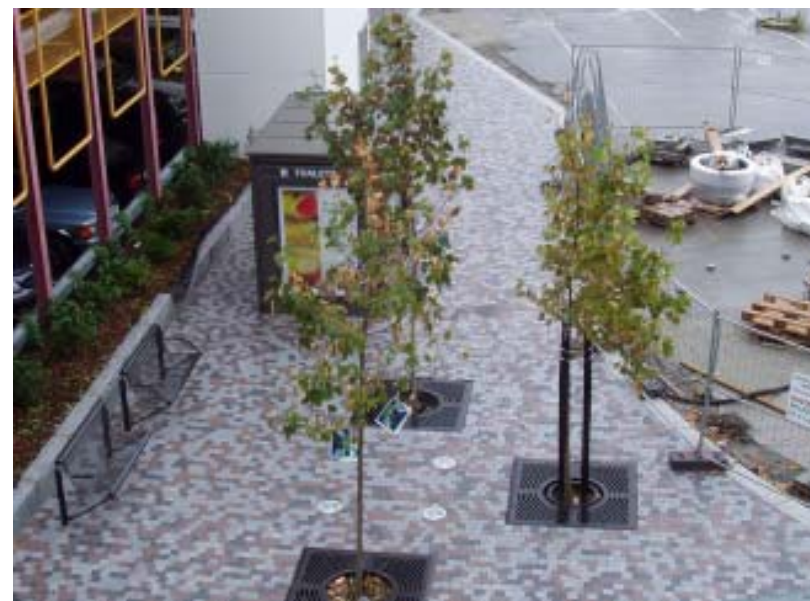
Serveringsareal med HC-toalett ved MagasinBlaa