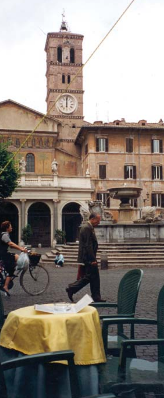
Kveldsstemning på Piazza Navona, Roma ►

Vi lærte det i Sør-Europa og etter hvert har også vi i Norden flyttet ut på gater og torg - opp til flere måneder i året. Ja enkelte sentrale byområder i Norge er i dag nesten dekket av uteserveringer på sommerstid!