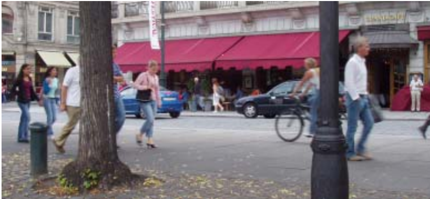
◀ Enkle markiser, Oslo