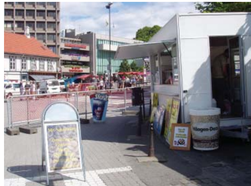
Kiosk med hele 8 ulovlige reklameoppsettinger, Ankertorget