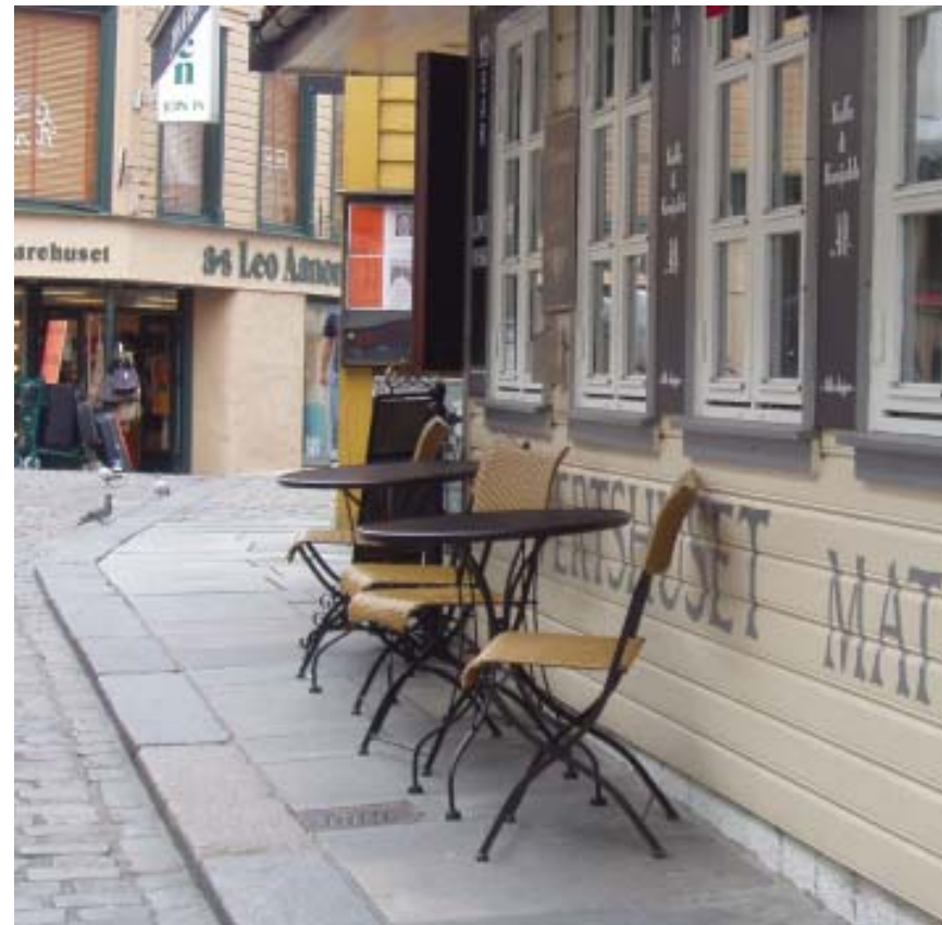
Fortau for bevegelseshemmede må ikke blokkeres som her, Skagen.

Det skal være universell atkomst fram til, utendørs serveringsområder. Fortau eller gangbaner tilpasset syns- og bevegelseshemmede må være fri for hindringer og derfor ikke brukes til uteserveringer. Også uteserveringens interne utforming og avgrensning må tilpasses funksjonshemmede.