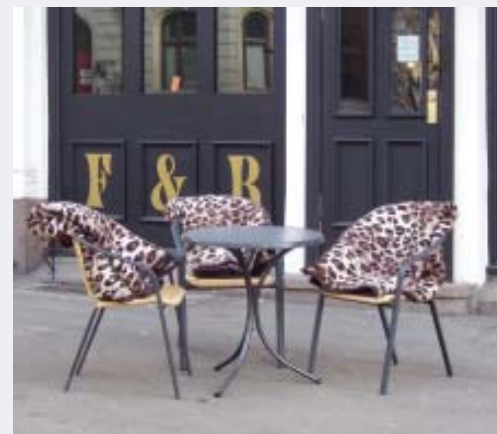
◀ Utemilø for kjølig vintervær. Stoler med pledd, Oslo.