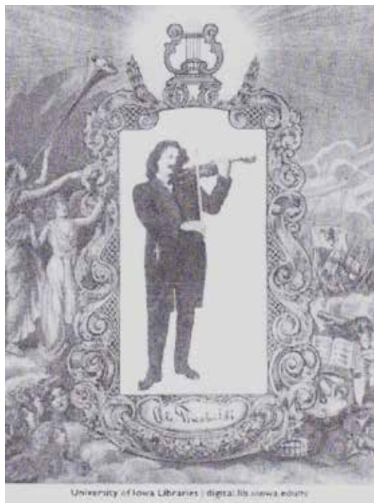
Illustrasjon av Theobaldi fra University of Iowa Libraries.

Theobaldi synes å ha vært like kreativ og fantasifull som sitt forbilde, Ole Bull, hva PR-stunt angikk! Dette var noe han tydeligvis fikk fordeler av særlig i USA der han promoterte sin egen karriere med å dele sine overdrevne og oppdiktede historier med sensasjonshungrige journalister og