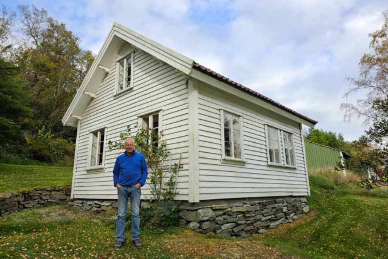
Folgehuset fra Jåsund