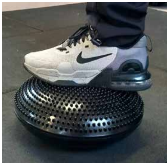
Balanse er vel så viktig som styrke. Her en balanseball i bruk.

Mye er skjedd, både innen dokumentasjon og