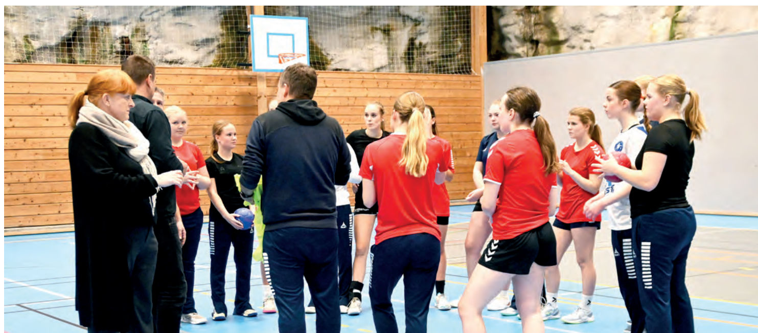
PEPTALK: Jentene under en fredagstrening som får peptalk fra trenere og foreldre.