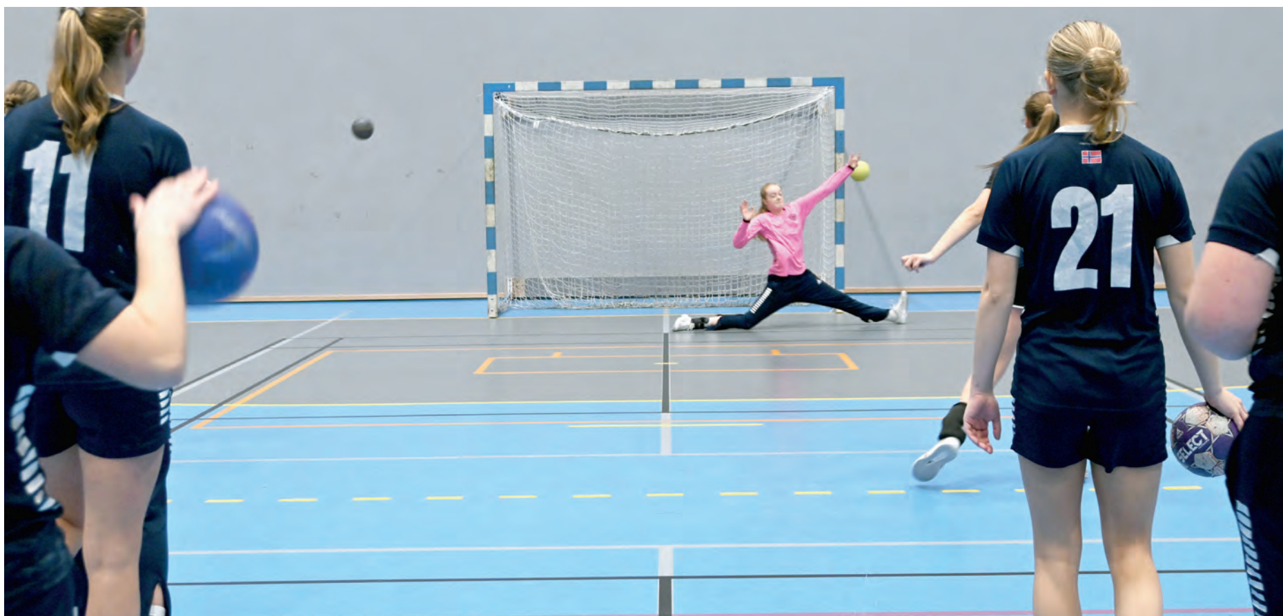
FRYKTLØSE: Jentene fra Tasta HK er beinharde. De skyter, scorer, og seirer som oftest.