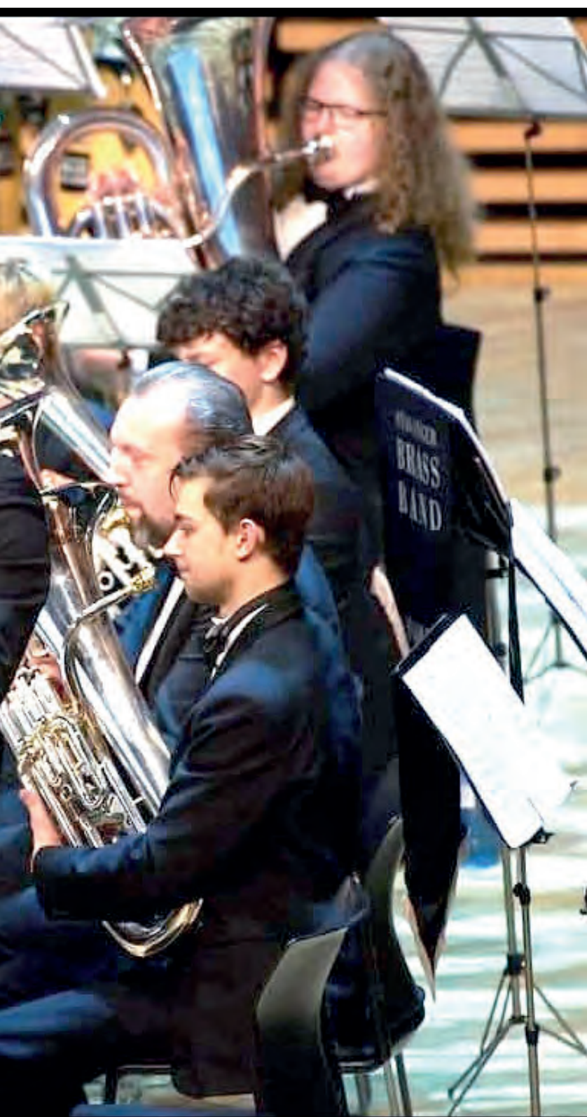
på RM 2024 i Fartein Valen, Stavanger konserthus.