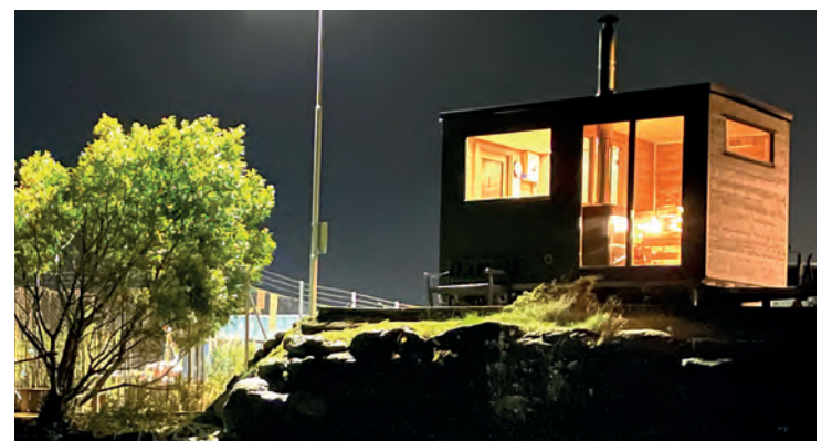
FRISKT VANN: På dette idylliske stedet kan de besøkende av saunaen ta seg et bad i sjøen om ønskelig.

De to eierne nevner at det enda blir en stund til, men at de holder seg optimistiske og venter spent på kommunens svar.