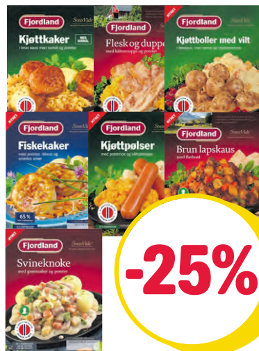
UTVALGTE FJORDLAND 455-535 g. Førpris fra 59,90