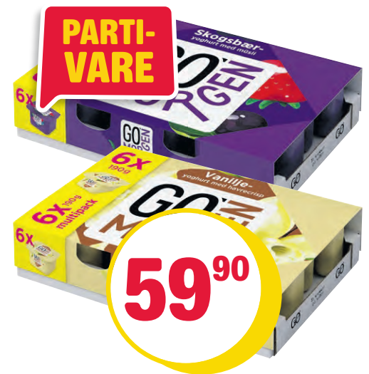
GO MORGEN YOGHURT 6 PK 2 varianter. 2 x 190 g. Pr pk. Pr kg 52,54