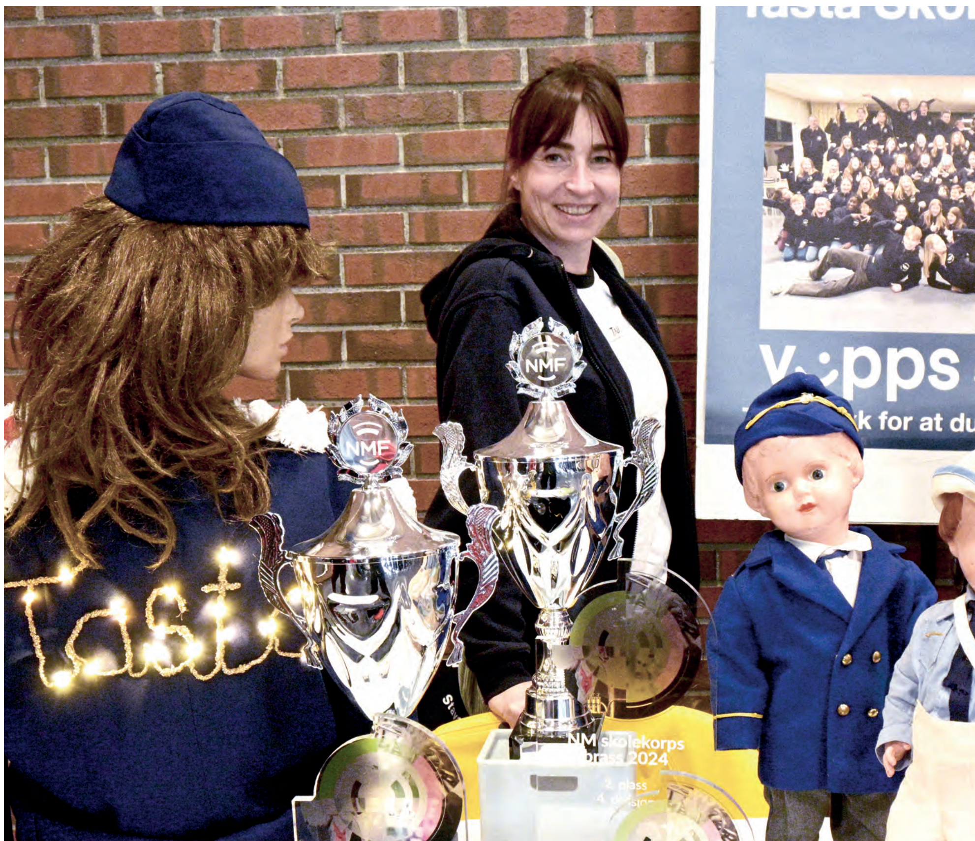
KORPSMØDRE: Ivrige korps mødre fra Tasta skolekorps tok turen til messen for å prøve å engasjere flere ungdommer, og for å vise at korps er gøy.

Arrangerte messe dedikert til ungdommen: