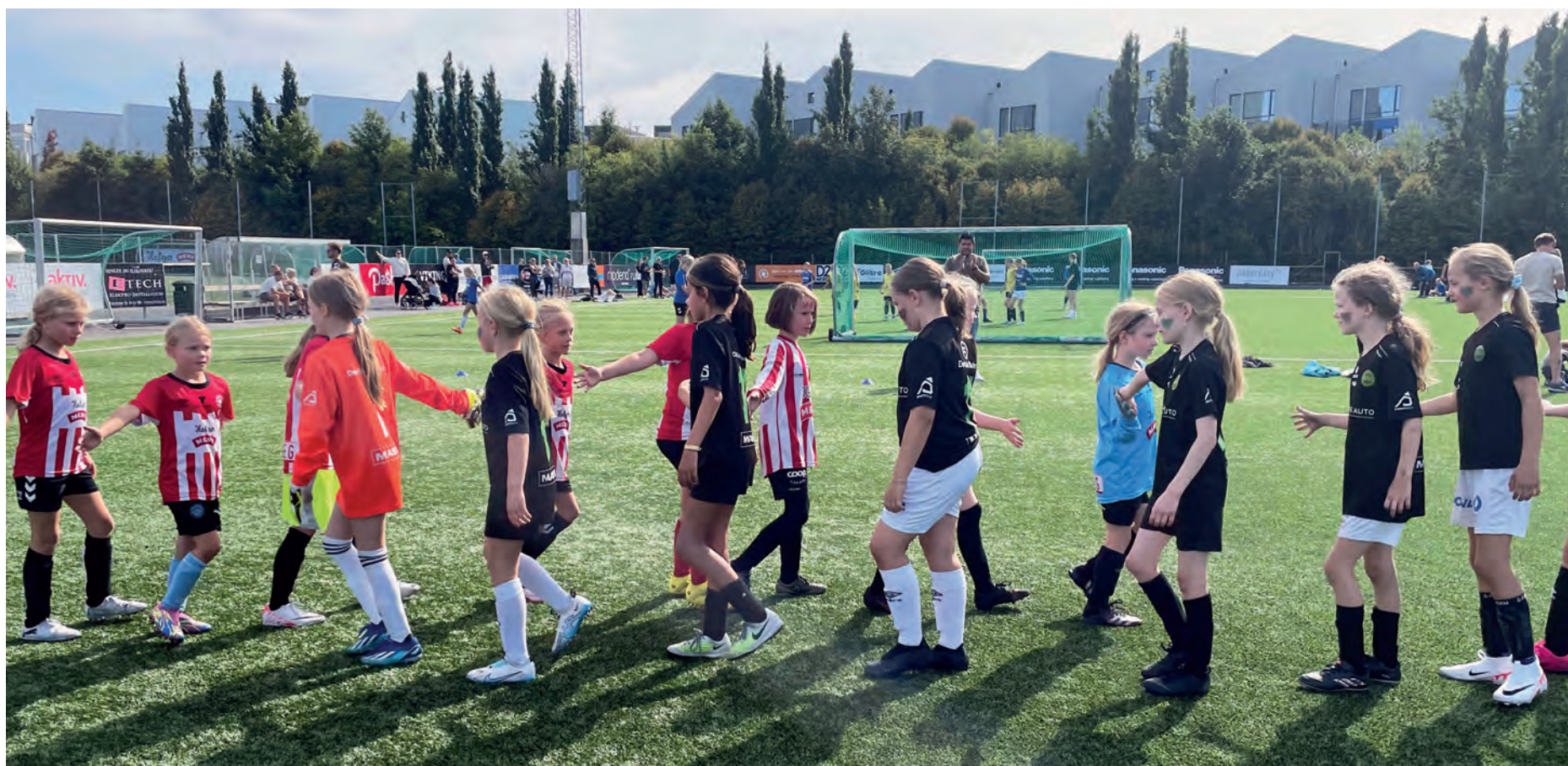
LAG VS LAG: Helgens cup brakte med seg spillere fra alle kanter, og dette var et godt møtepunkt som førte flere unge jenter sammen.

For andre året på rad arrangerte Vardeneset ballklubb «Panasonic jentecup» for jenter i alderen 7-13 år som spiller fotball. Dagen brakte med seg fint vær, godt oppmøte, og ikke minst engasjement for sporten.