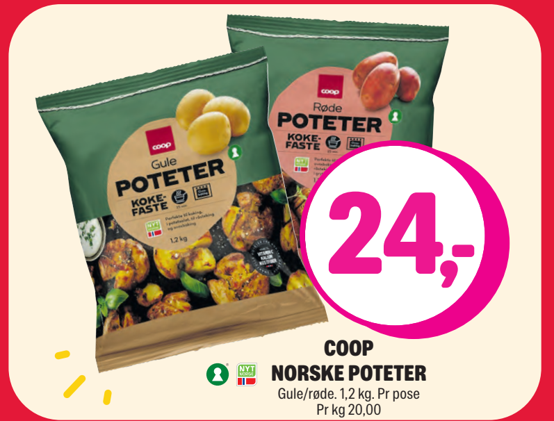
COOP NORSE POTETER Gule/røde. 1,2 kg. Pr pose Pr kg 20,00