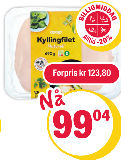
COOP KYLLINGFILET Naturell. 690 g. Pr pk. Pr kg 143,54