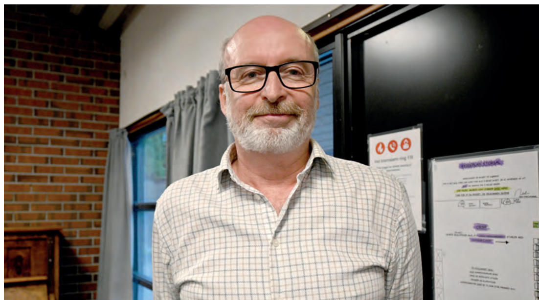
SAMFUNNET SETTES HØYT: Lokalsamfunnet og Tasta Bydel der han holder til, er en stor prioritet i Karlsons liv, og politikk. Her ser vi ham fornøyd etter en vellykket ungdomsmesse, arrangert av ham selv og Tasta arbeiderlag.