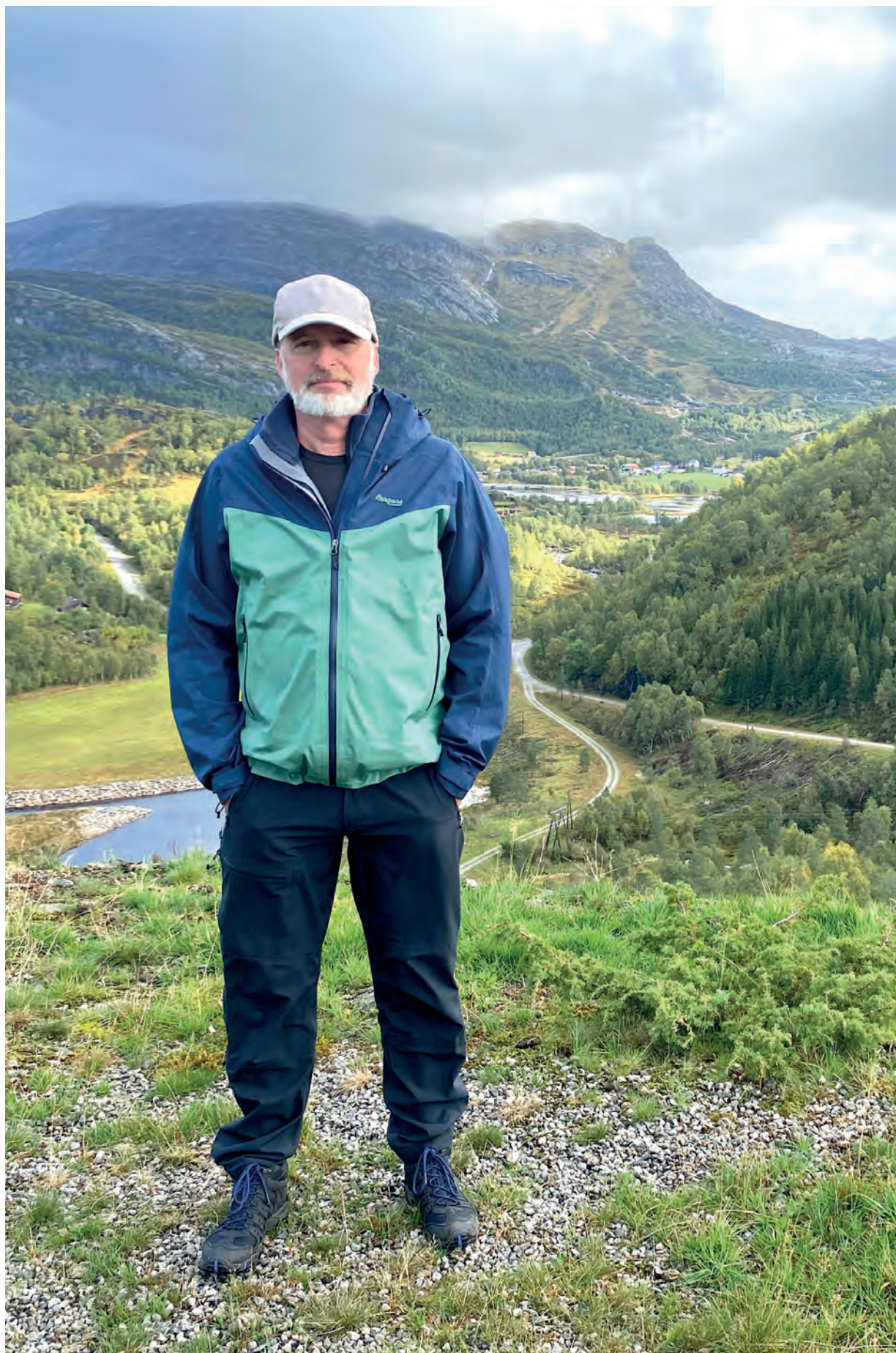
AKTIV: En av hobbyene til denne livlige mannen er å gå tur i fjellheimen. Det er da roen inntreffer.

- Jeg brenner for gode og trygge lokalsamfunn, og er opptatt av et levende sentrum. De siste årene har jeg merket på en viss interesse for naturvern, og at dette opptar meg mer og mer. Noe skjer med klimaet, og det bekymrer.