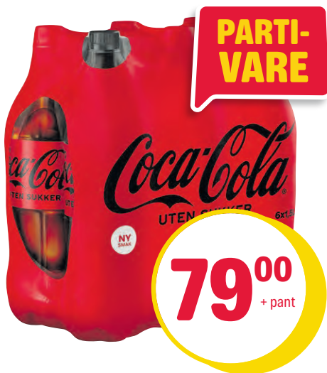
COCA-COLA UTEN SUKKER 6 PK 6 x 1,5 l. Pr pk. Pr 18,78